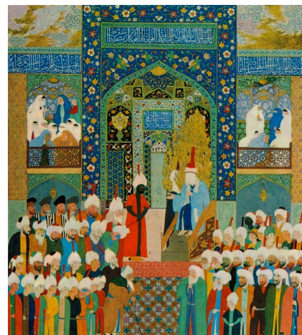
Последняя проповедь пророка Мухаммеда. Миниатюра Касима Али. 1525.

И даже сегодня ментальность, сформированная Кораном, влияет на судьбы всего человечества несравнимо больше, чем полторы тысячи лет тому назад, на момент ниспослания Корана.