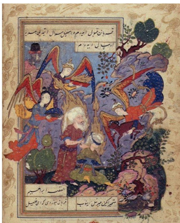
Жертвоприношение Ибрагим: ангел Джабраил дает овцу пророку Ибрагиму. Миниатюра из «Сада счастливых» Физули. XVI в.

«И воззвал Ангел Бога вторично к Аврагаму с неба, и сказал: «Клянусь Собой, сказано Богом, что, так как ты совершил это дело и не щадил твоего сына, твоего единственного , то Я благословлять буду тебя, и весьма умножу потомство твоё, как звёзды неба и как песок на берегу моря, и овладеет потомство твоё врагами своих врагов. И благословляться будут потомством твоим все народы земли за то, что ты слушался меня! И возвратился Аврагам к отрокам своим , и встали они, и пошли вместе в Беэр-Шеву, и остался Аврагам в Беэр-Шеве» (Брейшит 22 Ваера, 16—19).