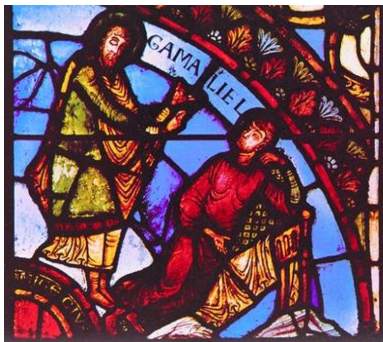
Прав. Гамалиил и ап. Павел. Витраж в соборе св. Винцентия монастыря Шалон-сюр-Сон (Франция). XIII в.