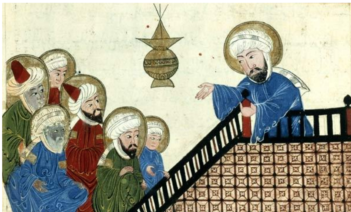
Проповедь пророка Мухаммеда. Турецкая копия XVII в. с персидской миниатюры XIV в.

Свидетельством этому является то, что сегодня внушительная часть землян не только исповедует основы вероустава, изложенные в Коране, не только признаёт выдающуюся роль Мухаммеда в распространении ислама, но и благоговейно склоняет свои головы перед «неучёным и необразованным пророком». Станет ли кто-либо отрицать то, что Мухаммеду, по Божьему «промыслу», удалось то, чего не смог сделать ни один выдающийся учёный и образованнейший философ, гениальный политик или великий вождь, император или президент самой мощной державы мира: с помощью Мухаммеда была сформирована и продвинута на новую ступень ментального развития внушительная часть населения нашей планеты.