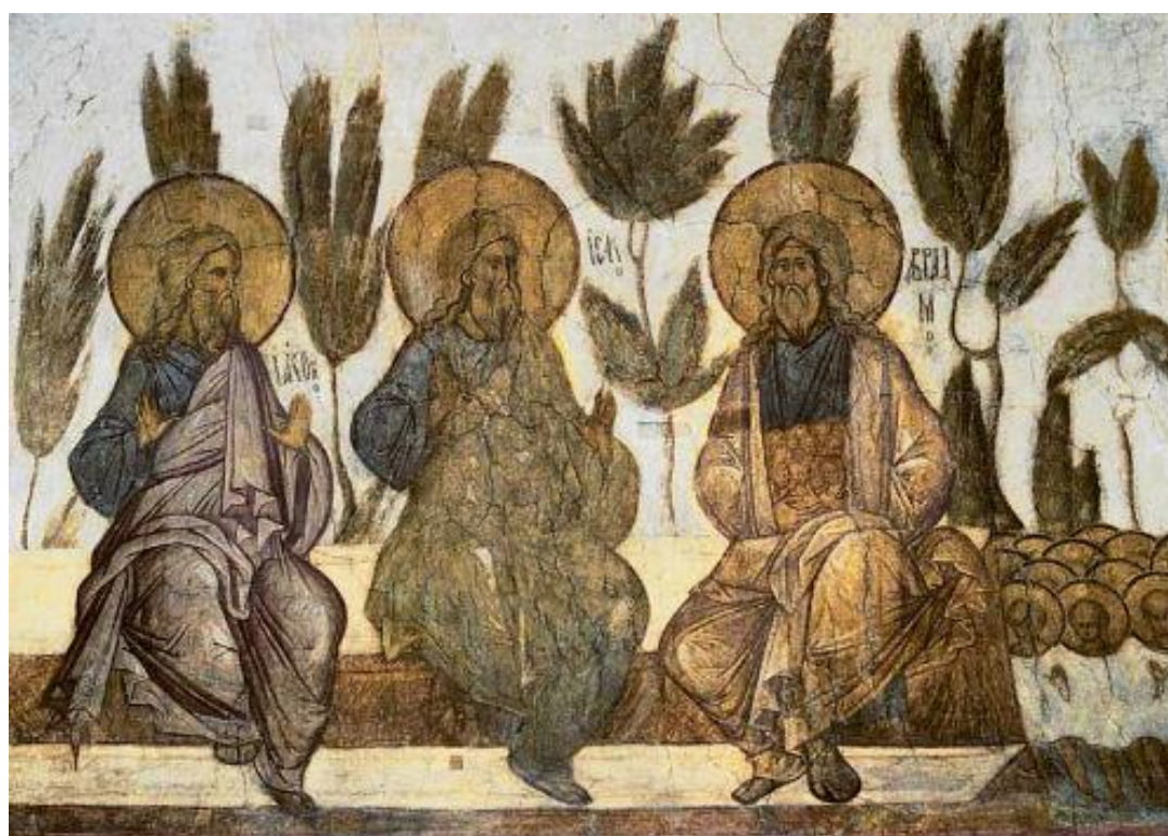
Лоно Аврамово. (Праотцы Авраам, Исаак и Иаков в раю). Фреска южного склона свода южного нефа Успенского собора во Владимире. 1408

В приведённом отрывке обращают на себя внимание три важных обстоятельства. Первое, Сам Бог называет Исаака « единственным сыном » Авраама.