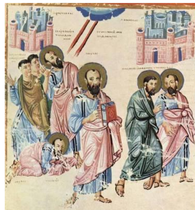
Обращение Савла. Миниатюра из византийской рукописи. Конец IX в.