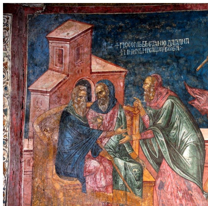
Фарисей Гамалиил в синедроне. Фрагмент нефа монастыря Высокие Дечаны (Дечаны, Косово). XIV в.

Нельзя не признать мудрости членов синедриона, а также великолепного знания ими сведений, переданных посредством Торы о том, кого следует считать пророками Всесильного и, наконец, их богобоязненности. Они вняли словам фарисея Гамалиила, и отпустили апостолов Иисуса. Чтобы не быть голословными, приведём ряд эпизодов Торы и Нового Завета, на которые ссылаются и которые прямо противоположным образом трактуются иудейскими, христианскими и магометанскими богословами.