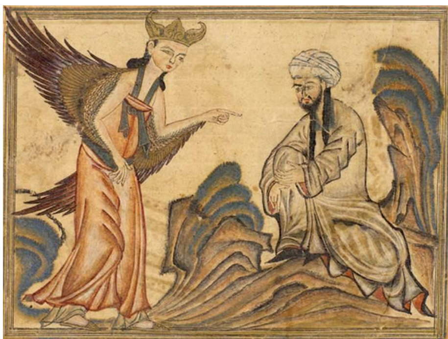
Пророк Мухаммед получает своё первое откровение от ангела Джабраила. Книжная миниатюра. 1307

Итак, возвестил ли Мухаммед, что-либо принципиально новое о «будущем», которое ранее было возвещено Иисусом. Конечно, нет! Ибо Мухаммед, не был носителем «новоявленного слова» о вечной жизни на небесах. Сведения о Судном Дне он также передал после того, как их передал Иисус! Возвестил ли Мухаммед миру что-то от себя лично или исключительно то, что было дано ему в Откровении? Нет, не возвестил. Он постоянно подчеркивал, как и любой другой пророк Единого Бога, что он говорит лишь то, что было ему открыто Господом.