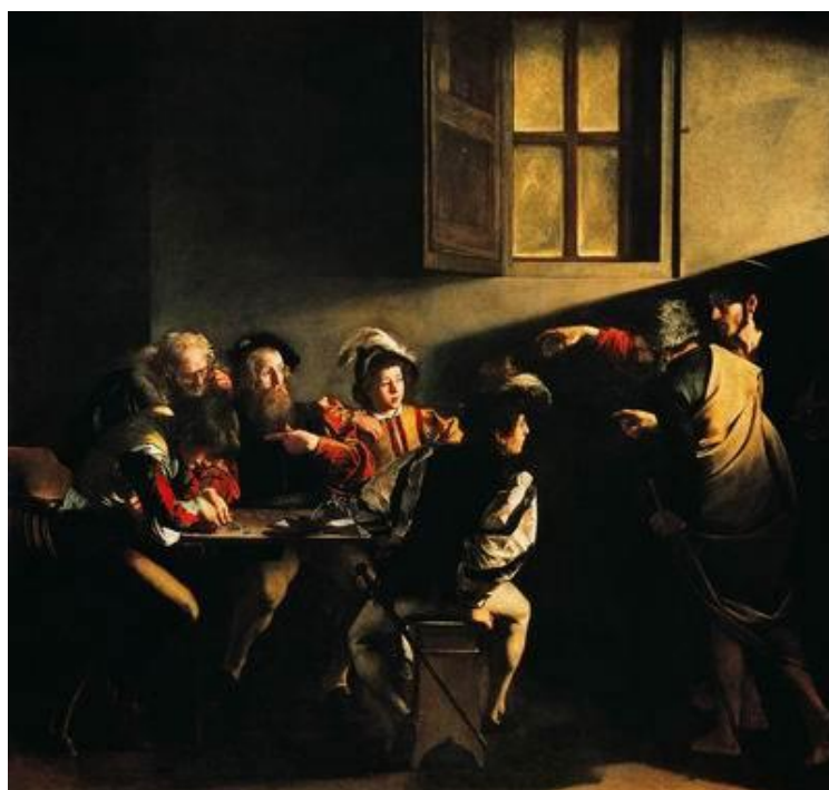
Призвание апостола Матфея. Микеланджело да Караваджо. 1599—1600