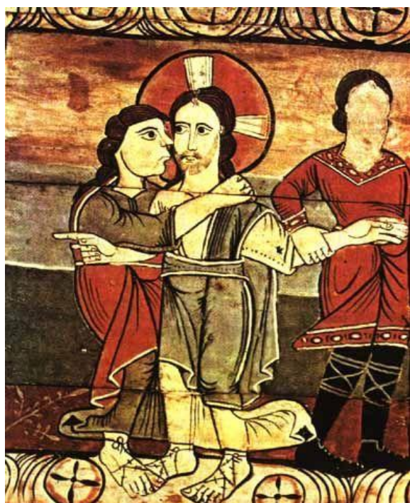
Поцелуй Иуды. Романская роспись. Ок. 1160

Конечно же, Иисус знал о той роли, которую надлежит сыграть Иуде. Но то, что функции двенадцатого апостола были возложены на другого ученика Иисуса, избранного после «предательства» и смерти апостола Иуды, не подлежат сомнению (Деян. 1: 26). Так же, как не подлежит сомнению и то, что и фарисей Савл, которому явился Иисус после Своего вознесения, стал одним из вернейших и значительнейших проповедников Нового Завета под именем апостола Павла. И потому не случайно, что не только Матфей, избранный по жребию одиннадцатыю оставшимися после Иуды апостолами, но и Павел, которого призвал Сам Иисус, названы апостолами Иисуса Христа (Деян. 1: 26; 9: 6). И стоит ли спорить, кому из последних двух апостолов будет предоставлена возможность судить одно из колен дома Израиля, если Иисусом названо число двенадцать?!